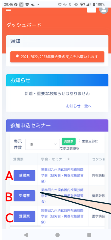
Aをクリックした受講票